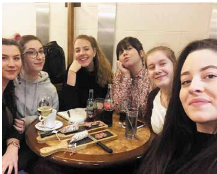
Les six membres bénévoles de l'association.

Membres de l'association « les p'tites blouses »,