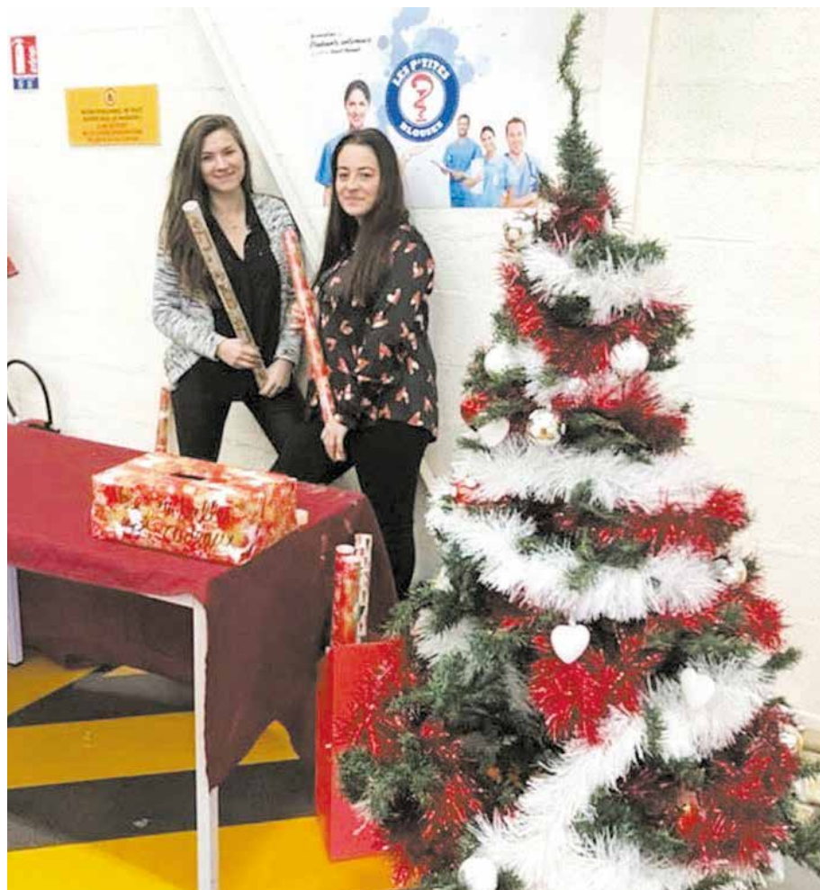
Stand emballage des cadeaux de Noël à Électro Dépôt : don pour une petite fille atteinte de la mucoviscidose.

En raison de la crise sanitaire du Covid-19, les futurs projets de l'association ont été annulés. Nos projets étaient en autres :